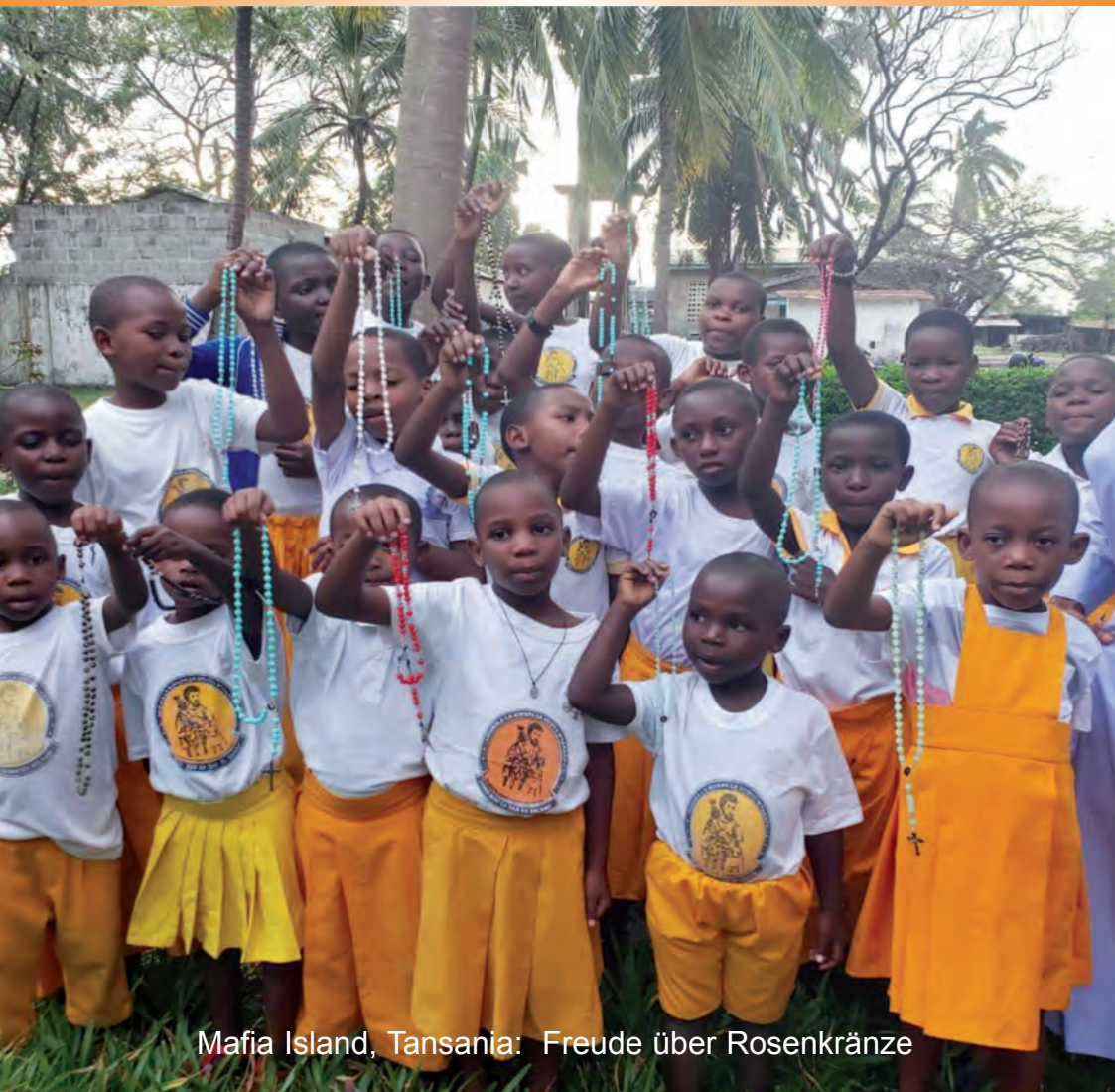
Mafia Island, Tansania: Freude über Rosenkränze

Impressum: Verleger und Herausgeber: St. Petrus Claver Verein - Maria Sorg, Maria-Sorg-Str. 6, 5101 Bergheim b. Salzburg. - Redaktion und graphische Gestaltung: Sr. M. Paula Krones. - Tel. 0662/452 097 - Internet: www.mariasorg.at - Spendenkonto: IBAN: AT61 3500 0000 0318 8380; BIC: RVSAAT2S - Druck: Offset 5020, 5072 Siezenheim.