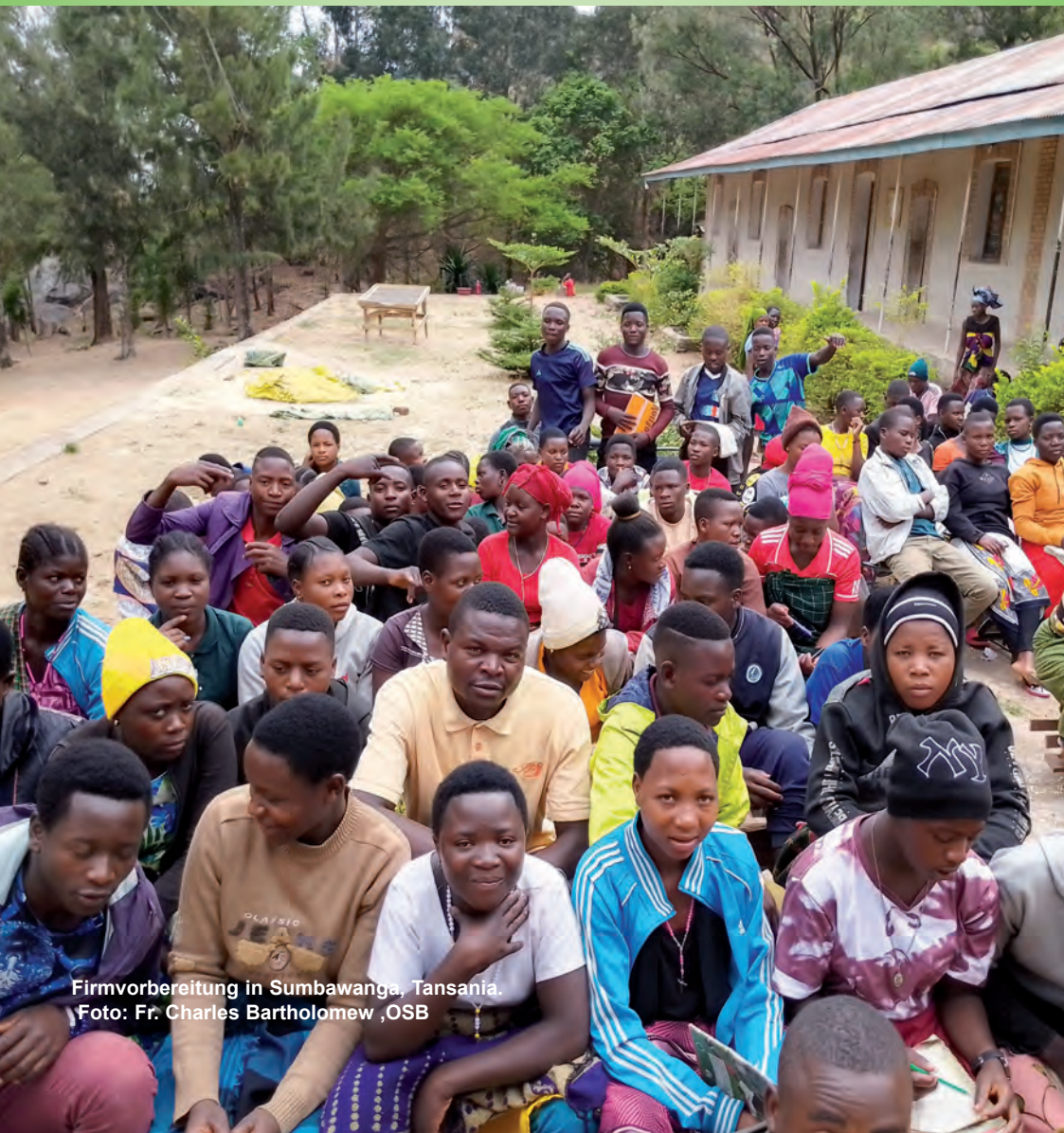
Firmvorbereitung in Sumbawanga, Tansania.