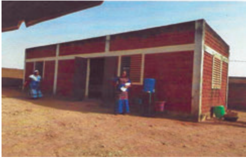
Mauer hinter dem Refektorium