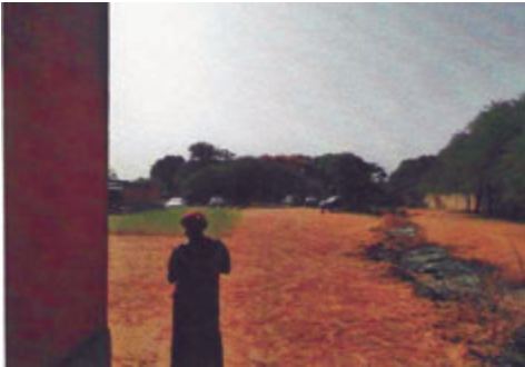
Südseite der Mauer