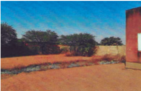
Westseite der Mauer beim Konferenzsaal