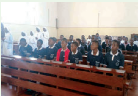
Bei der hl. Messe