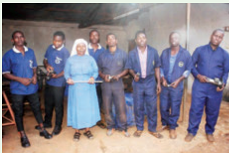
In der Werkstatt für Kraftfahrzeug-Mechanik