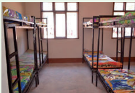
Schlafräume nach der Renovierung