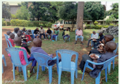
Bei der Mahlzeit