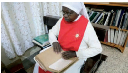
Morgengebet mit Buch in Brailleschrift

Tini: Sie führen ein kontemplatives Leben mit viel Anbetung des Allerheiligsten Altarsakramentes, sind aber auch aktiv in der Katechese tätig, begegnen den Menschen und sprechen mit ihnen über Jesus. „Wir opfern unseren Mangel an Sehkraft Gott für die Brüder und Schwestern auf, die die Wahrheit noch nicht kennen, damit sie Gott, das Licht der Welt, erfahren können“, sagt eine der Schwestern.