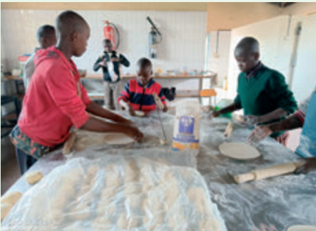
Unterricht im Backen

Die Consolata Missionare können nun mit Freude das Evangelium predigen und so die Träume der Evangelisierung und menschlichen Förderung des sel. Joseph Allamano verwirklichen.