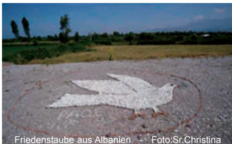
Friedenstaube aus Albanien

Gemeinsam mit Ihnen erleben wir die Gaben des Hl. Geistes für uns persönlich, für die Kirche und für die Menschen auf der ganzen Welt.