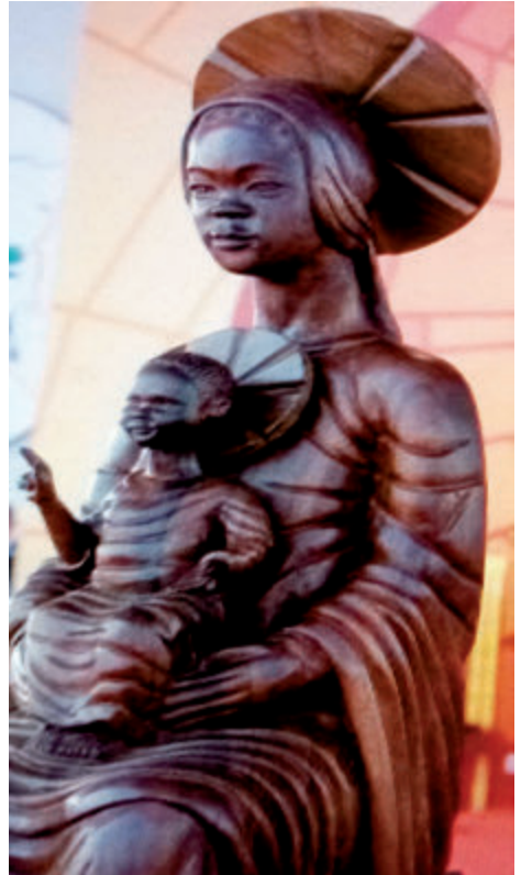
Unsere Liebe Frau vom Kongo - in der Kathedrale von Kinshasa

Beten wir dafür, dass in der Demokratischen Republik Kongo und im Südsudan sowie in ganz Afrika die Samen Seines Reiches der Liebe, der Gerechtigkeit und des Friedens gedeihen mögen.