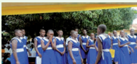
St. Theresa Mädchenschule Festmesse am 1. Oktober

Nachdem ich zum Vorsitzenden der Sonderkommission der Diözese für Flüchtlinge und Migranten ernannt wurde, erfülle ich diese Aufgabe vor allem durch meine Anwesenheit bei den Flüchtlingen in unserer Pfarrei, sowie auch durch die Koordination der Aktivitäten des Flüchtlingsvikariats in der gesamten Diözese.