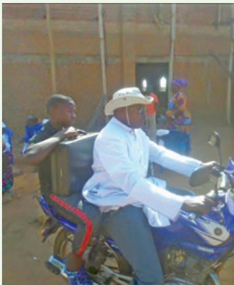
Heimkehr mit dem neuen Motorrad nach der Sonntagsmesse in der Christkönigskapelle in Unna