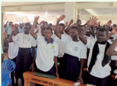
Heilige Messe bei den Katholischen Studenten (YCS) der Comboni- Gesamthochschule