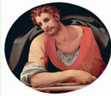
Hl. Markus von Angelo Bronzino

2013 wurde die St. Markus Mji Mwema Pfarre gegründet, die vorher eine Außenstation der Pfarre Kigamboni war.