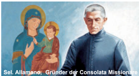
Sel. Allamano, Gründer der Consolata Missionare

Dies ist ein internationales Seminar mit derzeit 32 Seminaristen aus 8 verschiedenen Ländern. Für diese Aufgabe der Heranbildung von jun-