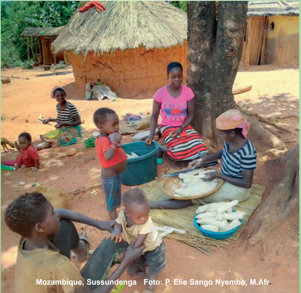
Mozambique, Sussundenga

Herausgeber: St. Petrus Claver Verein - Maria Sorg