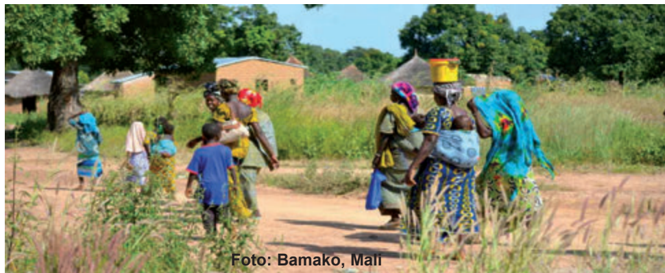
Foto: Bamako, Mali