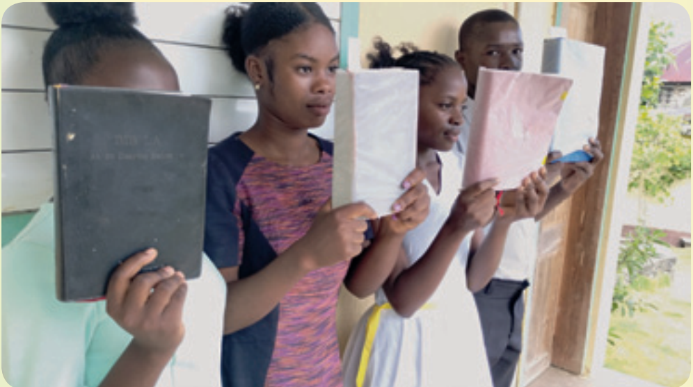
Aussendung beim Bibelkurs

Diese ernten durchaus von ihren Feldern, aber sie können die Produkte nicht verkaufen, da die Wege in die Stadtmärkte gefährlich sind. Unterwegs werden sie von Banden angegriffen, verlieren ihre Waren und werden ihres Lebens bedroht. So haben sie kein Geld, um andere lebens-