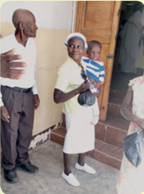
Empfang der Tagesrate

dene Bildungskurse durchzuführen. Während der Kurse werden die Teilnehmer gepflegt mit den Erträgen der Bauern, die dafür Entgelt erhalten. Wir sind erleichtert, denn nun