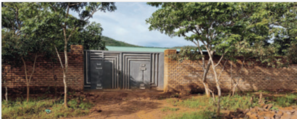
Sicht auf das Einfahrtstor mit dem errichteten Zaun

Wir haben auch mit unserem kleinen Beitrag einen Wassertank gekauft und installiert, damit wir das Regenwasser auffangen können. Dieses Wasser dient dann dem alltäglichen Waschgebrauch und zum Gießen unserer Pflanzen.