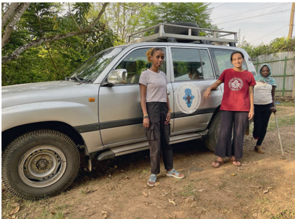
Arbeitssteam, bereit zur Abfahrt in ein Dorf