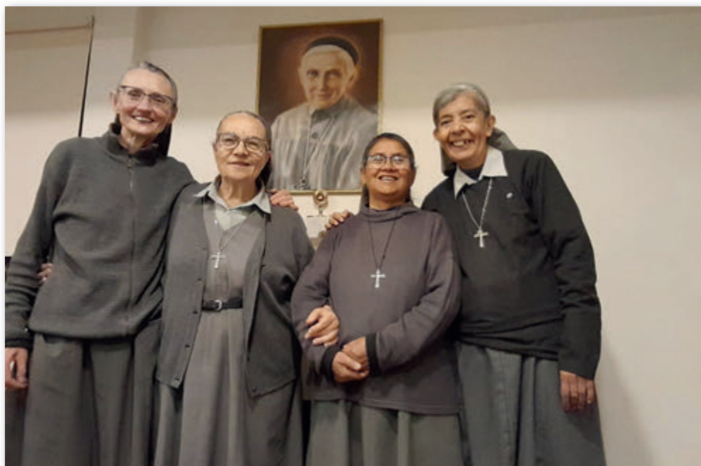
Ursulinen vom Herzen Jesu im Todeskampf in Oruro