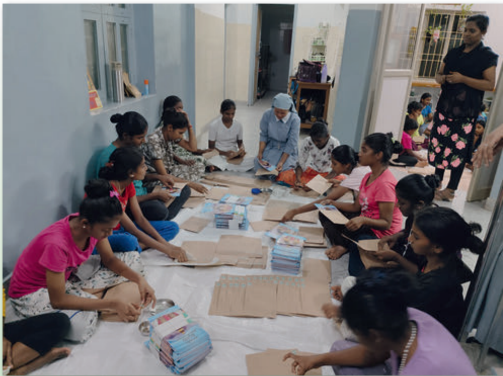
Tätige Hilfe beim Versand