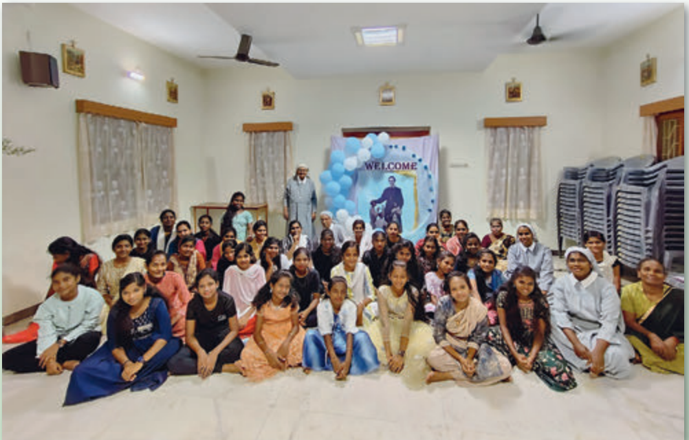
Gruppentreffen am Gedenktag der seligen Maria Theresia Ledóchowska

Die jungen Frauen sahen sich begeistert das Bild mit dem Text der Gebetsnovene an. Ich erklärte ihnen, dass sie sich jederzeit auf die Fürsprache der Seligen an Gott wenden können, wenn sie Hilfe brauchen – sei es beim Lernen, in der Familie oder in anderen Notlagen. Während Prüfungen und in schwierigen Zeiten beteten viele von ihnen voller Vertrauen zum