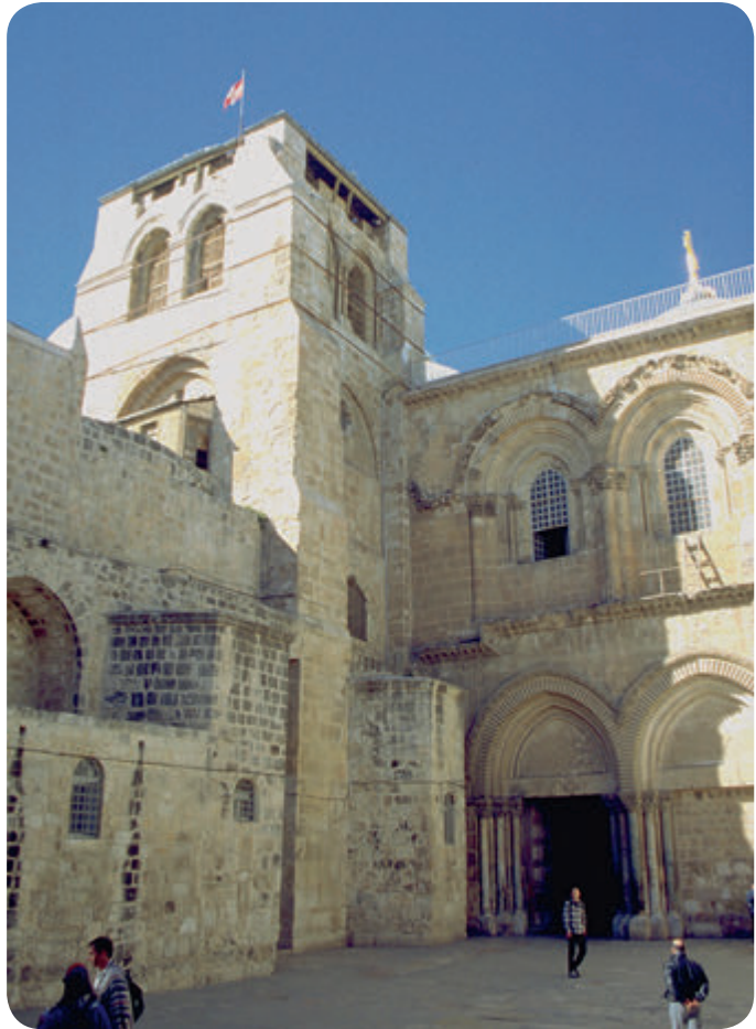
Grabeskirche in Jerusalem

Der Herr segne Sie und schenke Ihnen die Fülle der Gaben, die Sie persönlich im Alltag benötigen.