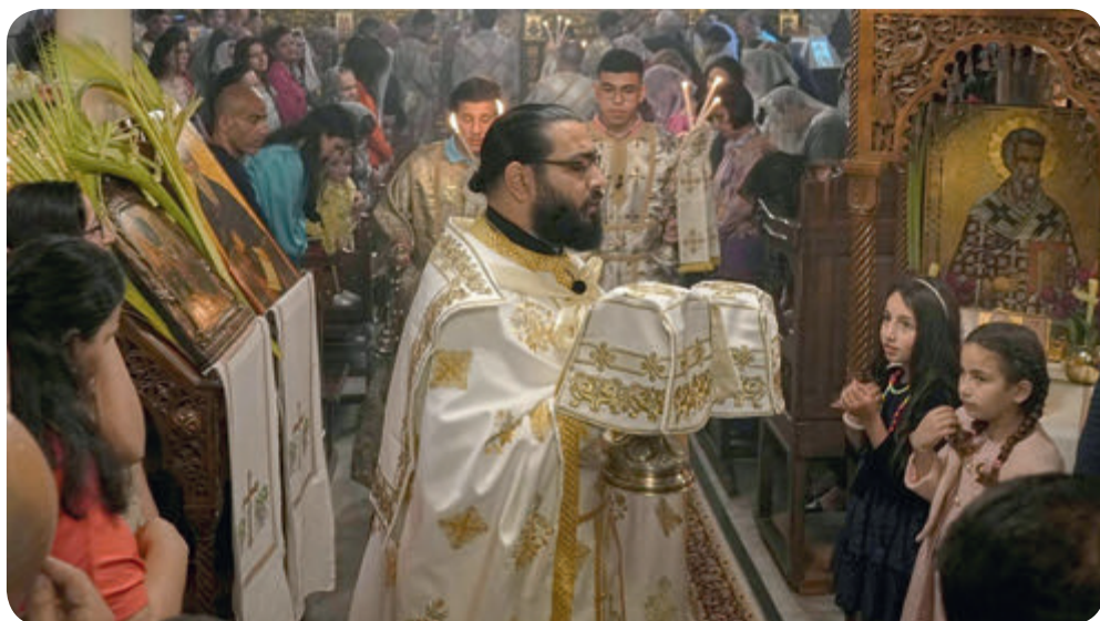
Palmsonntagsmesse der palästinensischen Christen in der griechisch-orthodoxen Kirche des heiligen Porphyrius in Gaza

Diese Hilfe war angesichts der aktuellen Lage im Heiligen Land besonders wichtig, wo viele Familien aufgrund von konfliktbedingten Arbeitsplatzverlusten und eingeschränkter Bewegungsfreiheit mit unerwarteten finanziellen Schwierigkeiten zu kämpfen haben.