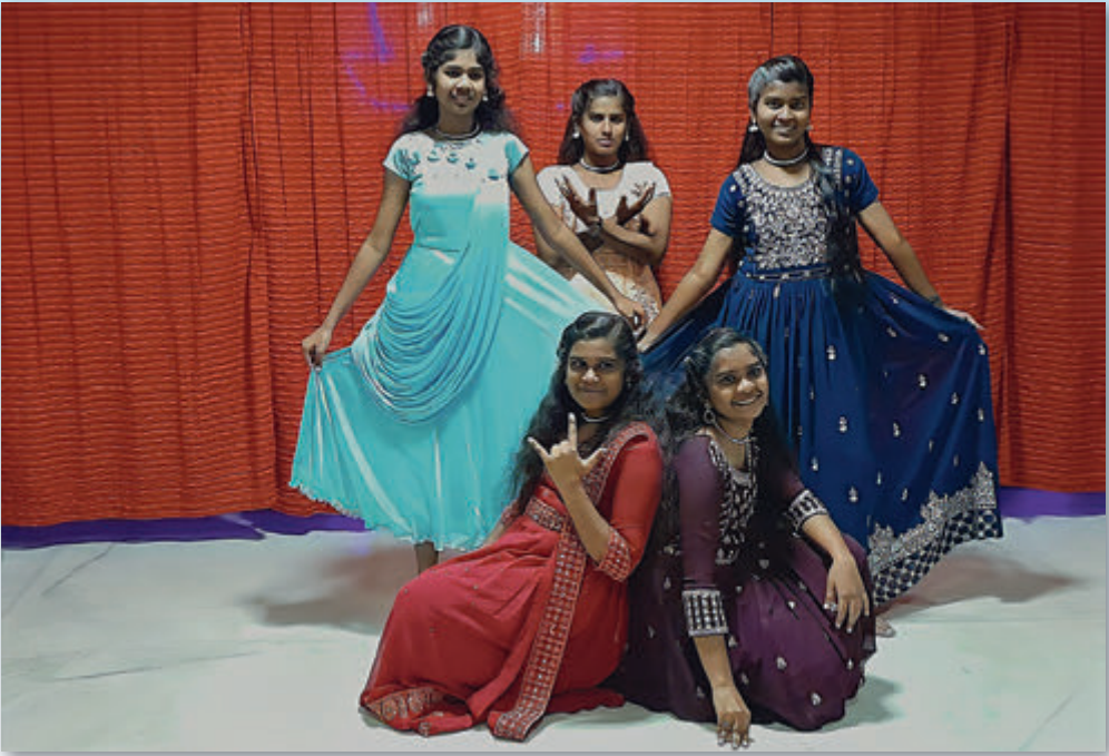
Tanz zu Ehren der Seligen

Herrn auf die Fürsprache der seligen Maria Theresia. Im Jahr 2025, während der Novene auf die Fürsprache der seligen Maria Theresia, die im Juli vor dem ihrem liturgischen Gedenktag am 6. Juli stattfand, luden wir die Mädchen erneut ein, den Noventext mitzubringen, um ihn gemeinsam zu beten. Eine von ihnen vertraute mir an, dass sie ihn nicht mehr besaß. Ich fragte sie nach dem Grund, und sie erzählte mir, dass sie ihn ihrer Mutter gegeben hatte, die Analphabetin war und aufgrund einer Hirnerkrankung unter starken Kopfschmerzen litt. Das Mädchen hatte ihr geraten, das Bild als Zeichen des Glaubens und des Vertrauens unter ihr Kopfkissen zu legen.