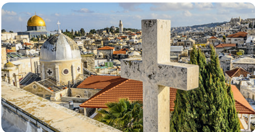
Sicht auf Jerusalem

Als Reaktion auf diese dringende Lage wurde ein gezieltes Finanzhilfeprogramm zur Unterstützung christlicher Familien im Westjordanland und im Gazastreifen ins Leben gerufen.