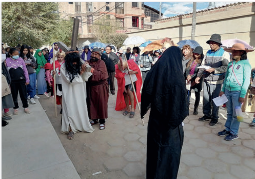
Kreuzweg auf den Straßen