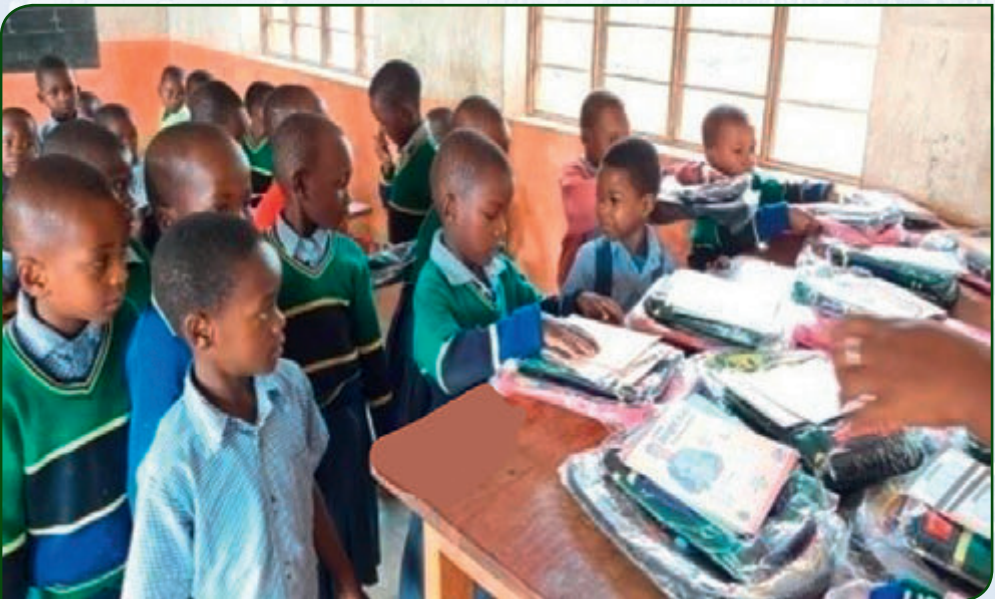
Große Freude über die Schulmaterialien

Um ihnen bei ihrer Bildung zu helfen, geben wir ihnen Lernmaterialien wie Notizbücher und Stifte, Schuluniformen, Schultaschen und Pullover. Sogar die Fenster konnten wir reparieren, damit die Kinder in Sicherheit lernen können, wenn sie bei uns sind. Wegen des schlechten Gesundheitszustandes der Kinder werden sie mit ausgewogenen und nahrhaften Speisen versorgt. Von Ihrer Spende haben wir eingekauft: Mais, Hirse, Reis, Eier, Bohnen,