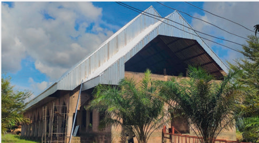
Kirche mit dem Dach