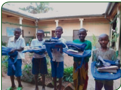
Schultaschen und Schuluniformen lassen die Gesichter strahlen