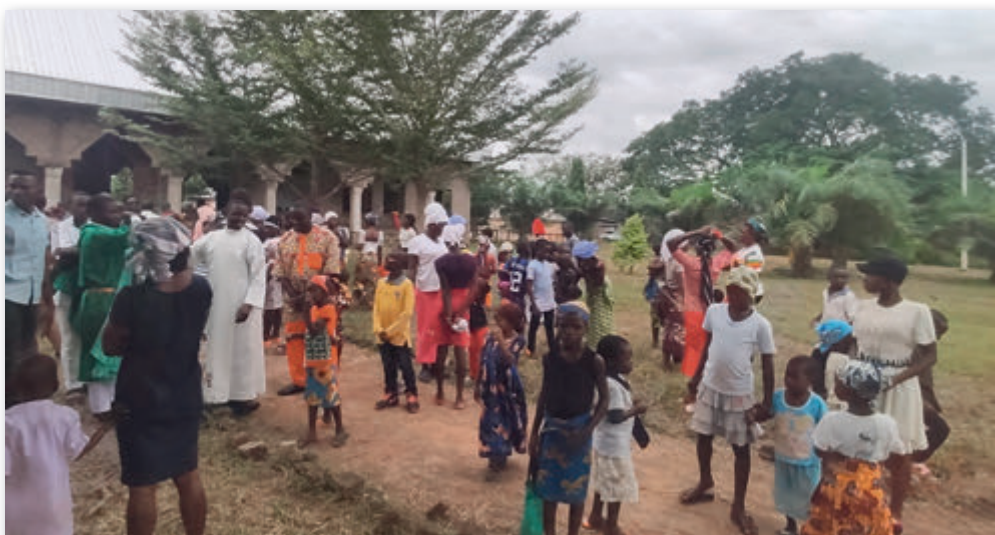
Zusammensein nach der hl. Messe