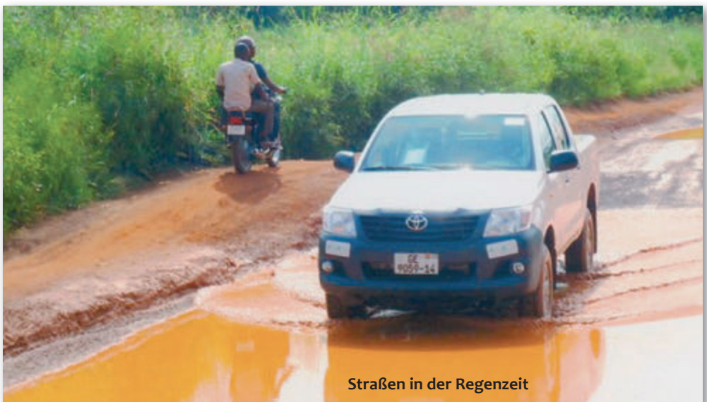
Straßen in der Regenzeit