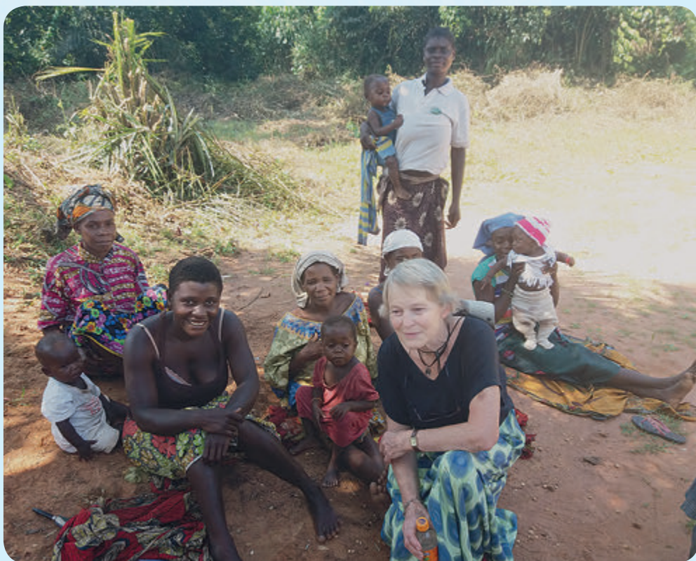
Unter Kindern und Frauen

Am Anfang meines Aufenthaltes beobachtete ich das Leben der Menschen und half bei den Hausarbeiten. Häufige Besuche in Kapellen, Schulen und Kindergärten halfen mir, das Leben und die Bräuche der Pygmäen und anderer lokaler Bevölkerungs-