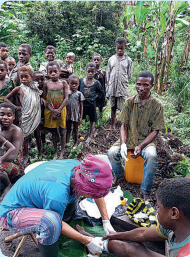
Bei der Behandlung

gruppen kennenzulernen. Die Menschen leben in sehr bescheidenen Häusern, wo auch verschiedene Nutztiere gezüchtet werden.