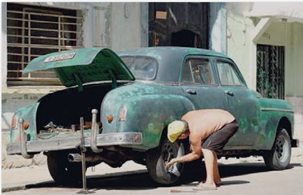
Autoreparatur als Notwendigkeit

dingungsloser Nächstenliebe. Da der Kommunismus Gott leugnet und damit auch die Liebe zum Nächsten, die aus dieser Quelle entspringt, hat er eine unlösbare Aufgabe.