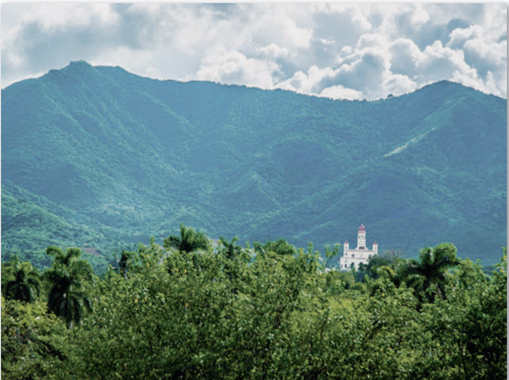
Sicht auf die Basilika del Cobre außerhalb von Santiago de Cuba

Ein weiterer Grundsatz ist die Transformation in eine gleichere Gesellschaft. Die Realität sieht wieder anders aus. Es gibt 2 %, die in ihren Äm-