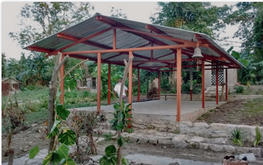
Kapelle in Guabairo