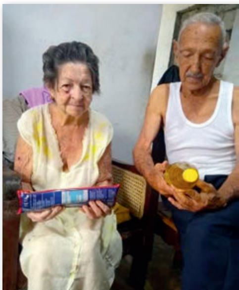
Verteilung der Nahrungsmittel

Kuba hat eine Regierung ohne Gott, die zuerst ihre eigenen Taschen füllt, bevor sie an die Bedürftigen denkt.