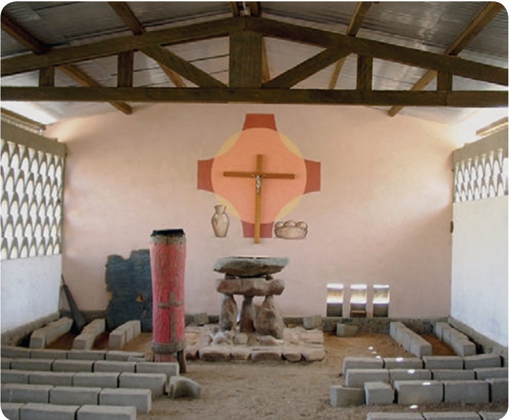
Einfache Ausstattung einer Kapelle