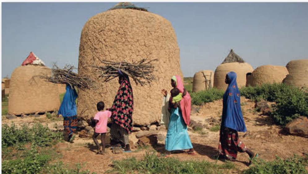
Getreidespeicher im Dorf

Das wenige Geld, das sie hatten, wurde ihnen nicht weggenommen. So sind die Witwen in die prekären Lebensbedingungen zurückgekehrt, die das Schicksal von Tausenden von Vertriebenen aufgrund der Angriffe und Drohungen der bewaffneten Gruppen prägen. In Niger leben über 500.000 Vertriebene zusammen mit den Flüchtlingen.