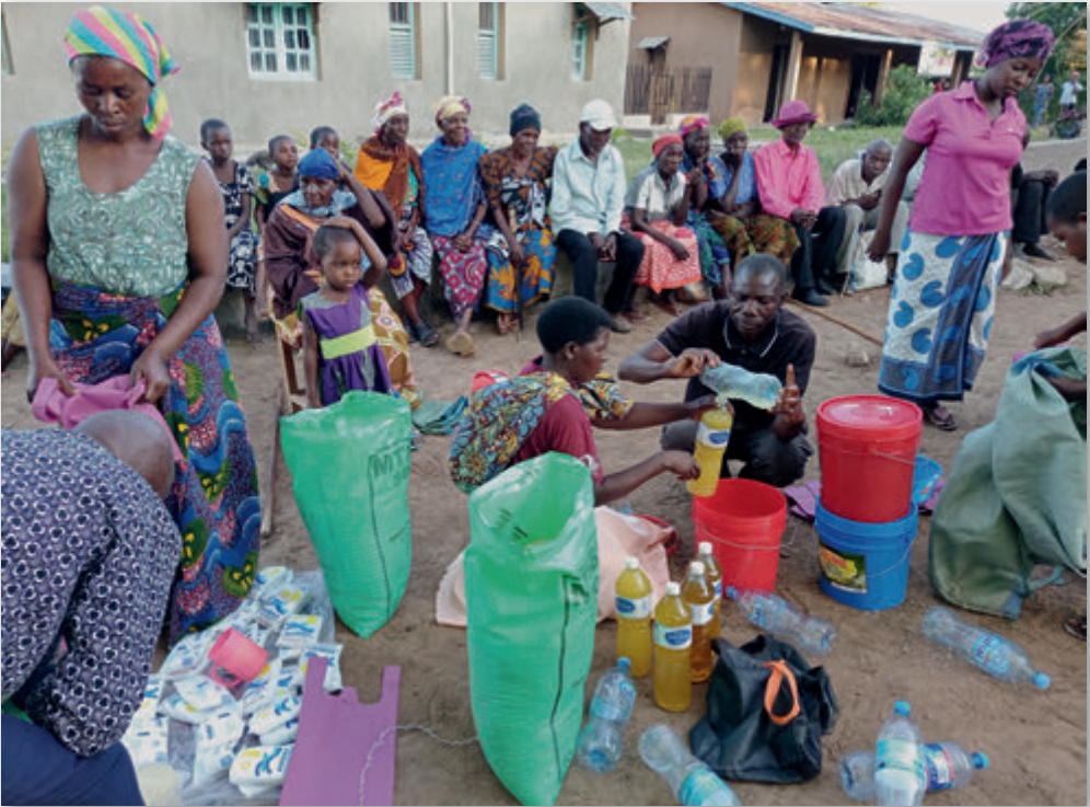
Verteilung am Ort

täter, Ihr Gut in der Form des Geldes mit ihnen geteilt haben, obwohl Sie selbst unter der Teuerung und der Steigerung der Preise leiden und einige Entbehrungen auf sich nehmen müssen.