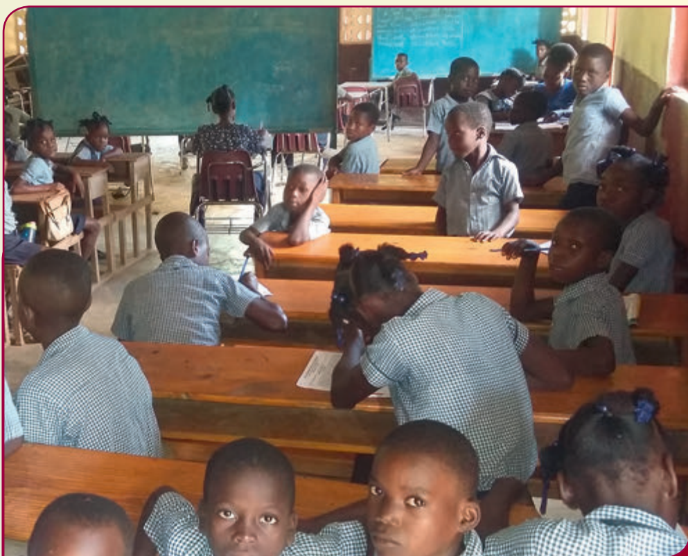
Einsatz in der Schule

Dank sei dem Herrn für seine Führung und Begleitung bei den Schulungen und Ihnen für Ihre Unterstützung zugunsten dieses Unterfangens. Ihre Spende wurde für den Einkauf von Bibeln, Notizbüchern, Schreibmaterial, Broschüren und Lehrerlohn verwendet. Damit die Vorträge nicht nur theoretisch blieben, haben alle Teilnehmer der Schulungstage eine Praxis in den verschiedenen Gemeinden durchgemacht. Ohne Ihre Unterstützung hätten wir uns das nicht erlauben können, weil wir kein Geld für Treibstoff hatten. Essen und Getränke in diesen Tagen wurden auch von Ihrer Gabe bezahlt, da die Teilnehmer sehr arm sind.