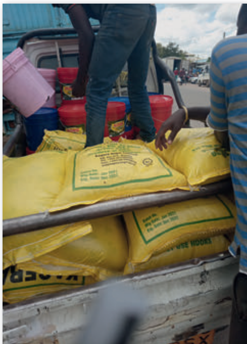
Verladung der Lebensmittel

Jeden Monat wird in jeder Pfarrei die Verteilung der Grundnahrung für die Ärmsten der Armen durchgeführt. Dafür wird mit Hilfe der Erzdiözese und mit dem Geld der Pfarreien eine große Menge von Öl, Reis, Bohnen und Mais eingekauft. Manchmal werden auch Getränke für die Kinder ausgeteilt, wenn wir dafür zusätzliche Spenden erhalten.