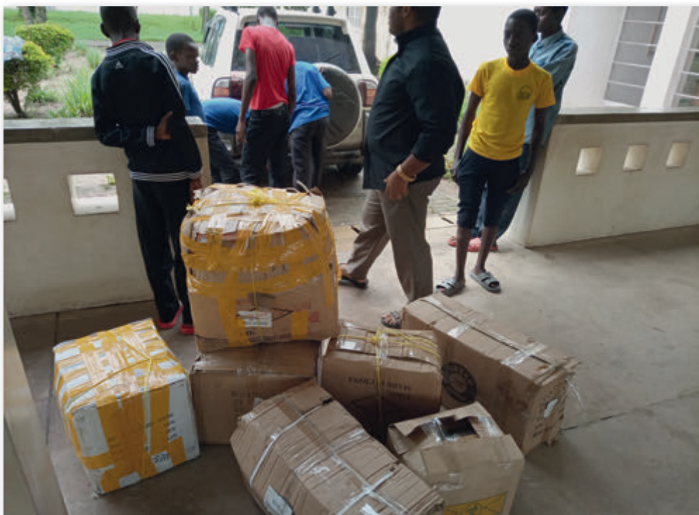
Vorbereitungsarbeiten vor dem Transport

Wir danken Ihren Wohltätern, liebe St. Petrus Claver Schwestern, für deren Spende für den Einkauf der Grundnahrungsmittel. Sie bedeutet für uns sehr viel und schenkt manchen Menschen einen Hoffnungsschimmer in den Engpässen, die sie durchmachen müssen. Diese Menschen wissen, dass Sie, liebe Wohl-