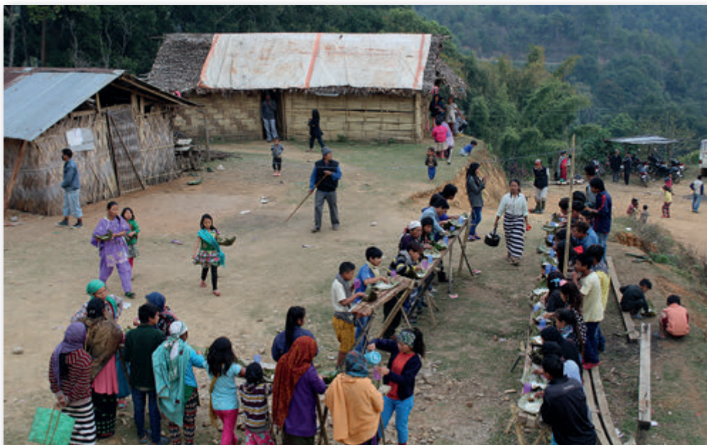
Unterricht in einem Dorf

In vielen Pfarreien, müssen unsere Priester noch selbst die Menschen in der Pfarrei unterstützen, weil diese mittellos sind. Sie sehen, liebe Wohltäter, dass die Geldmittel für Mess-Intentionen richtig eingesetzt werden und ich überprüfe dies genau.