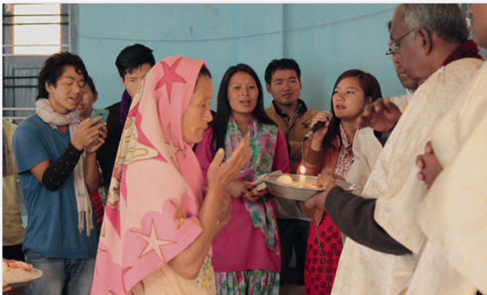
Gang zur Gabenbereitung

In vielen Pfarreien, müssen unsere Priester noch selbst die Menschen in der Pfarrei unterstützen, weil diese mittellos sind. Sie sehen, liebe Wohltäter, dass die Geldmittel für Mess-Intentionen richtig eingesetzt werden und ich überprüfe dies genau.