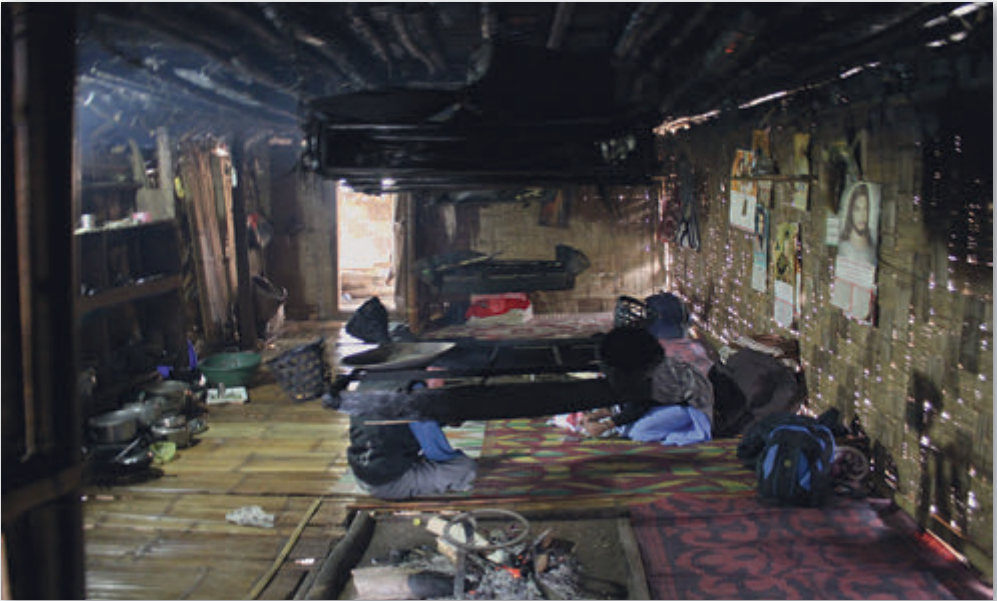
Wohnstätte eines unserer Patres