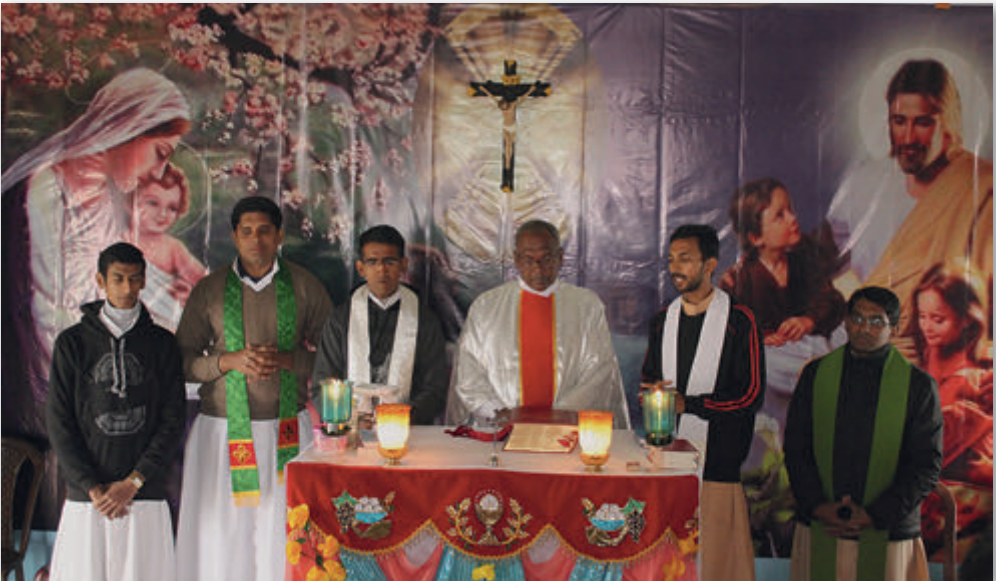
Messfeier ohne elektrisches Licht

Ihre Messstipendiengaben sind für uns eine große Hilfe. Wir verwenden Ihre Spenden nach der Zelebration der heiligen Messen als Zuschuss für das Bildungshaus oder sie kommen den einzelnen Missionaren zugute, die kein Einkommen haben und auf die Hilfe und Unterstützung der Gläubigen in den Pfarreien nicht rechnen können. Viele Kirchen sind in miserablen Zustand. Es gibt kein Wasser und keine Elektrizität.