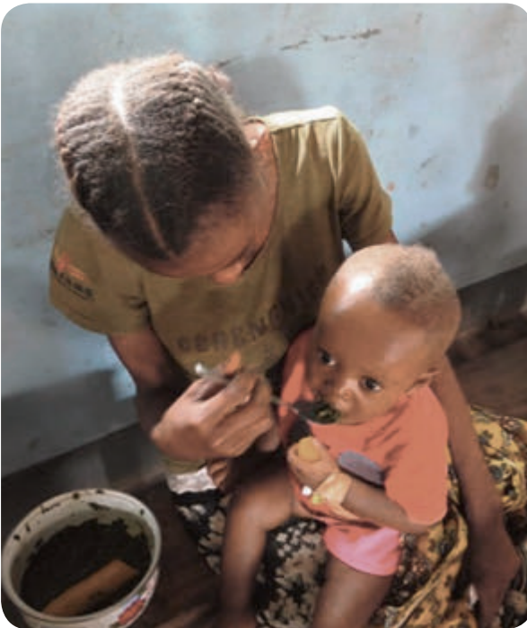
Mittagessen im Krankenhaus

Trotz einer stagnierenden sozioökonomischen Situation spielt das Krankenhaus weiterhin eine wichtige Rolle für die Gesundheit in unserer Provinz. Es bietet qualitativ hochwertige Pflege und genießt einen guten Ruf. Von den nationalen Behörden wird es sehr geschätzt. Diejenigen Patienten, die mittellos sind, werden im Krankenhaus behandelt und mit den notwendigen Medikamenten versorgt. Allerdings können wir das ohne Ihre finanzielle Hilfe, liebe Wohltäter, nicht weiterhin tun. Auch die Pygmäen werden kostenlos behandelt.