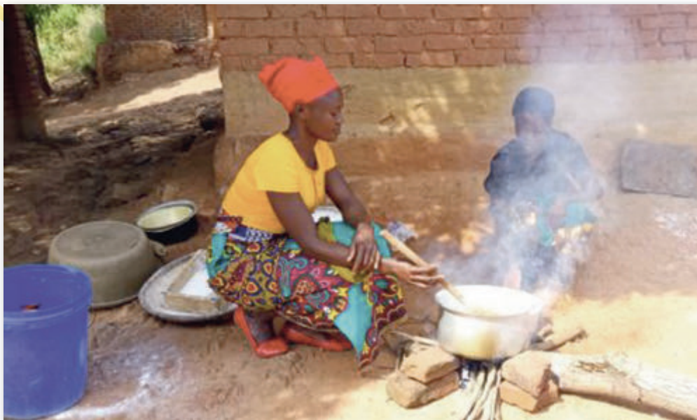
Zubereitung der Mahlzeit

Insgesamt wurden nach der Ernte 320 Säcke Reis geerntet und es verbleiben zwei Haushalte mit 6 Parzellen, die Ende Dezember bis Anfang Januar geerntet werden und nicht weniger als 40 Säcke produzieren werden. 850 Säcke Mais und 210 Säcke ungeschälte Erdnüsse wurden geerntet. Jeder Haushalt, der von diesem Zuschuss profitiert hat, ist Ihnen und allen, die für dieses Projekt Geld- und Sachspenden gespendet haben, dankbar und zeigt seine Dankbarkeit durch Gebetsgruppen in den kleinen christlichen Gemeinden sowie bei unseren Zusammenkünften in der Kirche.