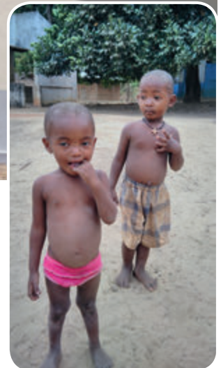
Im Hof des Leprakranken-Dorfes

und Ihnen, liebe Wohltäter, sehr dankbar. Ohne Ihre Hilfe hätten wir das nie schaffen können! Ihre finanzielle Unterstützung haben wir sowohl für den Bau von den Behausungen wie auch für den Einkauf von Nahrungsmitteln und Medikamenten verwendet. Die Nahrungsgaben wurden nicht nur an die Dorfbewohner verteilt, sondern auch an