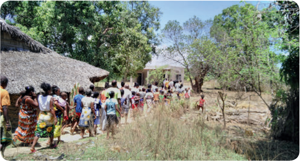
Im Hintergrund eines der fünf erbauten Häuschen für die Leprakranken und ihre Familien