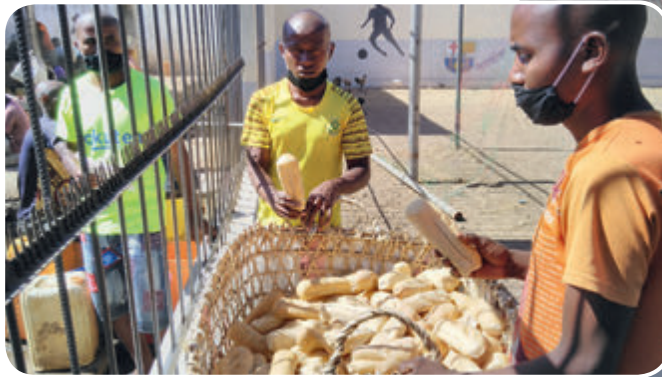
Brotverteilung im Gefängnis