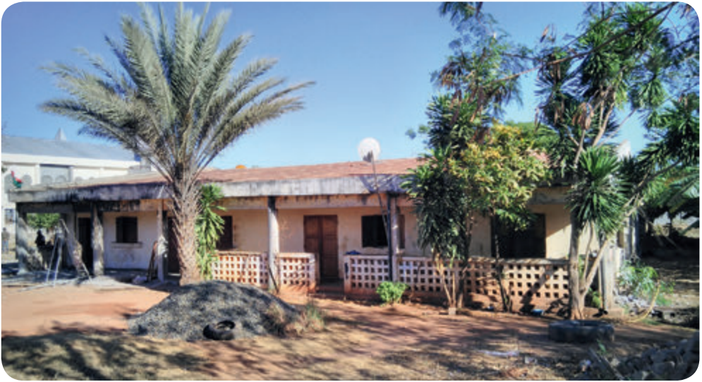
Sicht auf unser einfaches Gemeinde- und Verwaltungshaus

Endlich können wir Ihnen, liebe Missionsfreunde und Wohltäter, eine freudige Nachricht zukommen lassen. Wir konnten fünf kleine Wohnhäuser für unsere Leprakranken und ihre Familien bauen. Auch wenn die bisherigen Ergebnisse kleiner wegen der verschiedenen Widrigkeiten ausgefallen sind, sind wir Gott