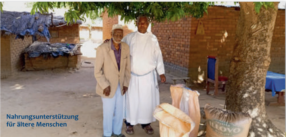
Nahrungsunterstützung für ältere Menschen