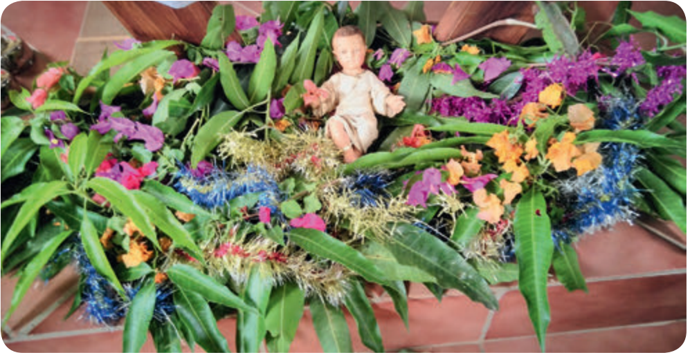
Unsere Krippe letztes Weihnachten

Wir sind dankbar für Ihre Unterstützung. Die Beschenkten baten uns, ihre Dankbarkeit an alle Geber weiter auszusprechen. So sagen wir allen Wohltätern ein herzliches Vergelt's Gott und versprechen unser ständiger Gebetsgedenken in unseren Gottesdiensten in der Gefängniskapelle oder im Lepradorf-Kirchlein.