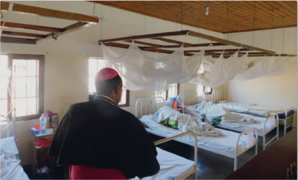
Besuch des Bischofs im Krankenhaus

zeugend ihren Glauben. Sie leben nach dem, was sie bekennen und nehmen aktiv am Leben in der Kirche teil.