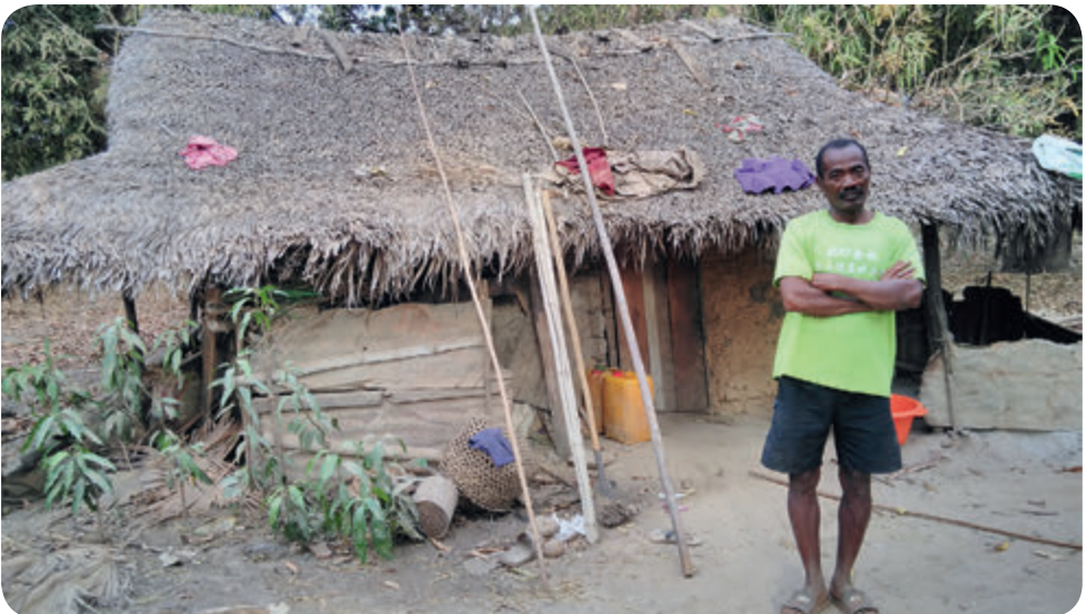
Eine alte Behausung der Leprakranken