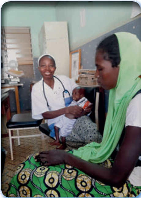
Schwester bei der Untersuchung