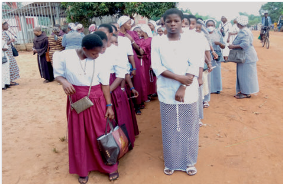
Fußwallfahrt nach Bena-Kalongo