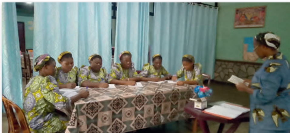
Bildungstagung der Novizinnen

Wir senden Ihnen einige Fotos mit unseren jungen Novizinnen, die jetzt in der Ordensausbildung sind.