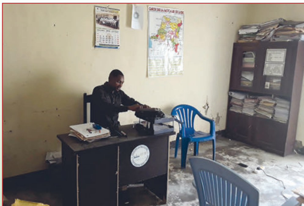
Unser Büro vor dem Umzug

In diesem Schreiben möchten wir Ihnen, liebe Wohltäter, erläutern, wie das Projekt durchgeführt wurde und wie die erhaltenen Mittel verwendet wurden.