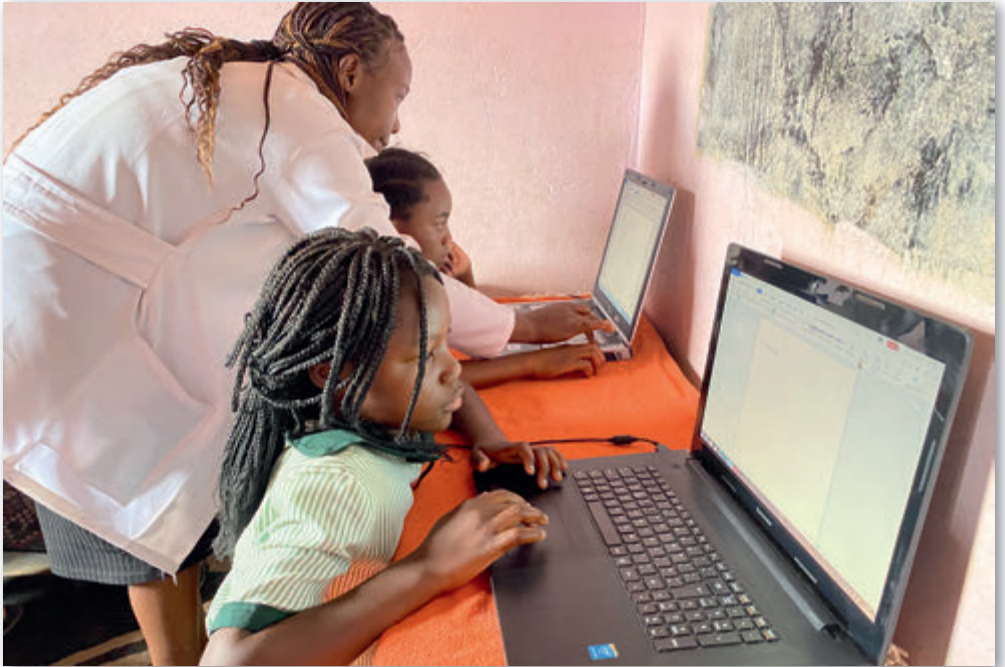
Computerschule ist gefragt

Eine Kindergärtnerin, die sich für eine Stelle in einem Pfarrkindergarten beworben hatte, erzählte im ersten Vorstellungsgespräch, dass ihr die Lehrerin im Informatikunterricht an einer Pädagogischen Hochschule eine Tastatur an die Tafel gemalt habe. An der Universität gab es auch keinen Computer.