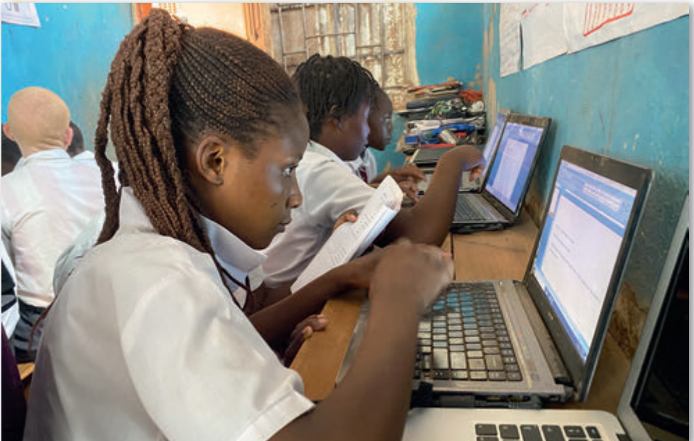
Computerklasse in Linda, Sambia