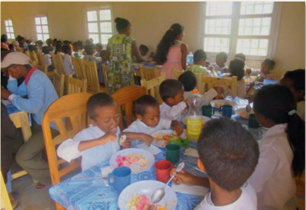
Mittagessen in der Schulkantine

Im Schuljahr 2022–2023 haben die Schüler alle Prüfungen am Ende des Jahres bestanden und können die nächste Klasse besuchen. In jeder Stufe von T1 bis T5 wiederholte niemand ein Jahr und kein Schüler brach die Schule ab.