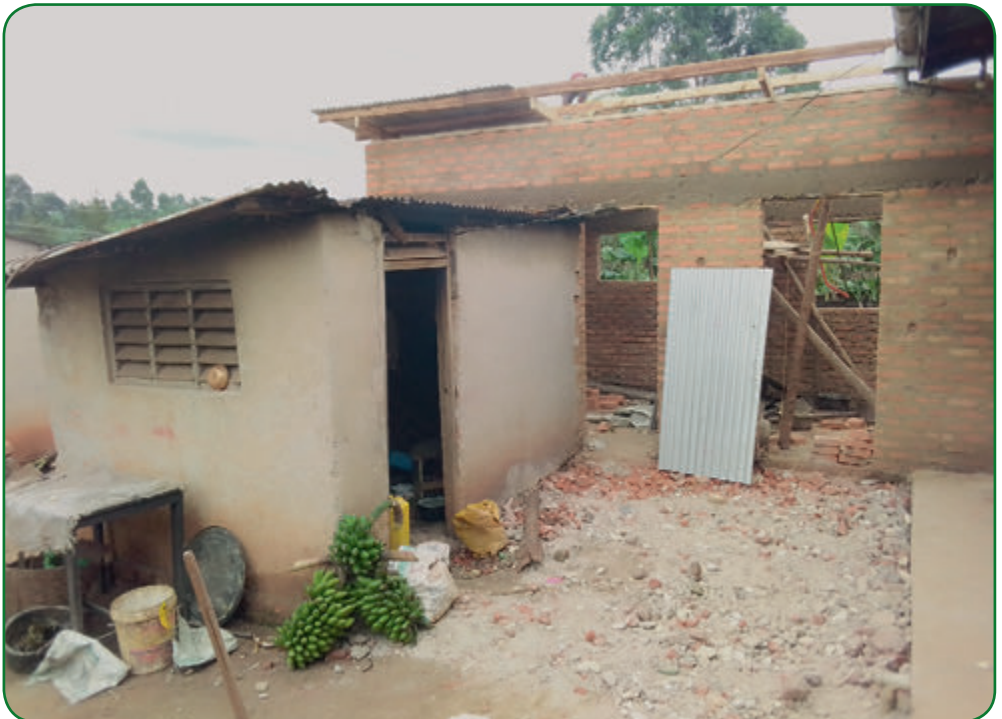
Küche im Bau

Nun ist die Sicherheit vor wilden Tieren und Dieben gewährleistet.