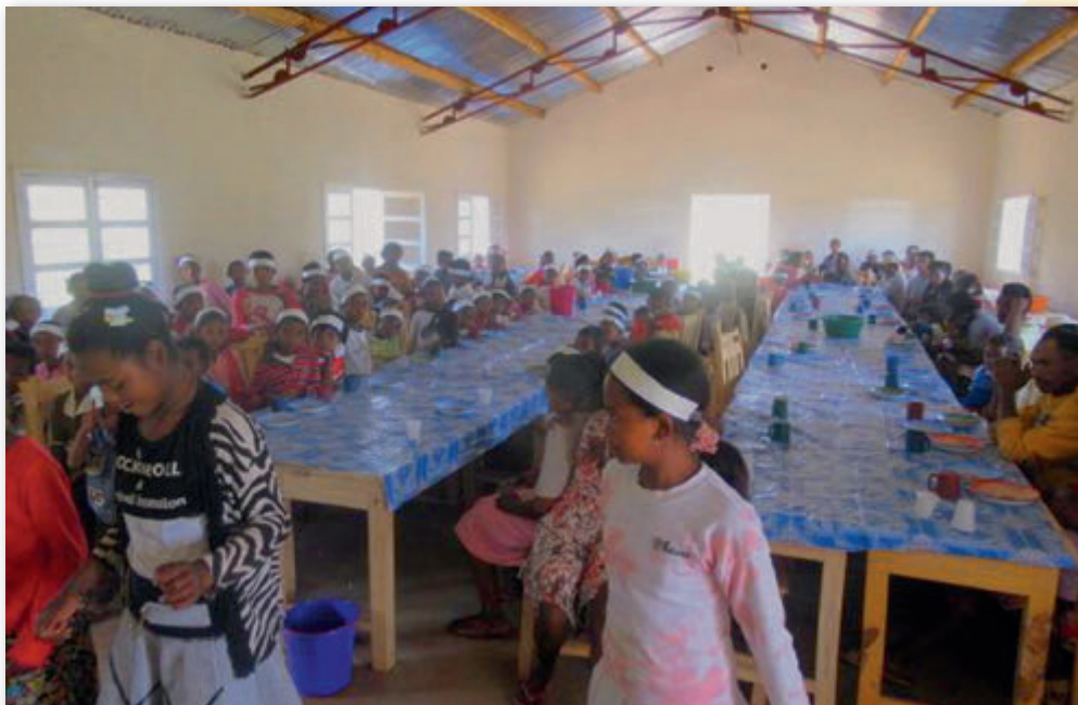
Sicht auf die ganze Schulkantine

Derzeit bereiten wir Eltern darauf vor, sich nach und nach aktiv am Betrieb der Schulkantine und deren Nachhaltigkeit zu beteiligen. Wir möchten so dem Nahrungsmangel vorbeugen. So bewirtschaften die Eltern der Schüler den Schulgarten und führen den Reisanbau und den Getreideanbau sehr gut an den Hängen. Diese Maßnahmen sind nicht nur in der Schule, sondern auch in den umliegenden Gebieten sehr erfolgreich und spornen die hiesige Bevölkerung an.