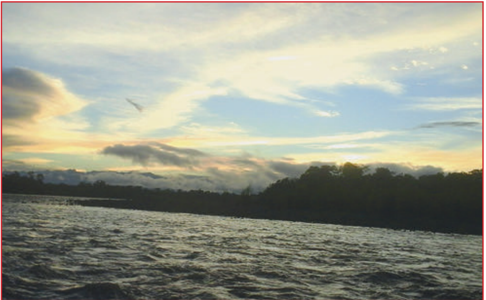
Am Fluss Rio Portoviejo

Gott sei Dank wird auch in dieser wirtschaftlich unsicheren Zeit die