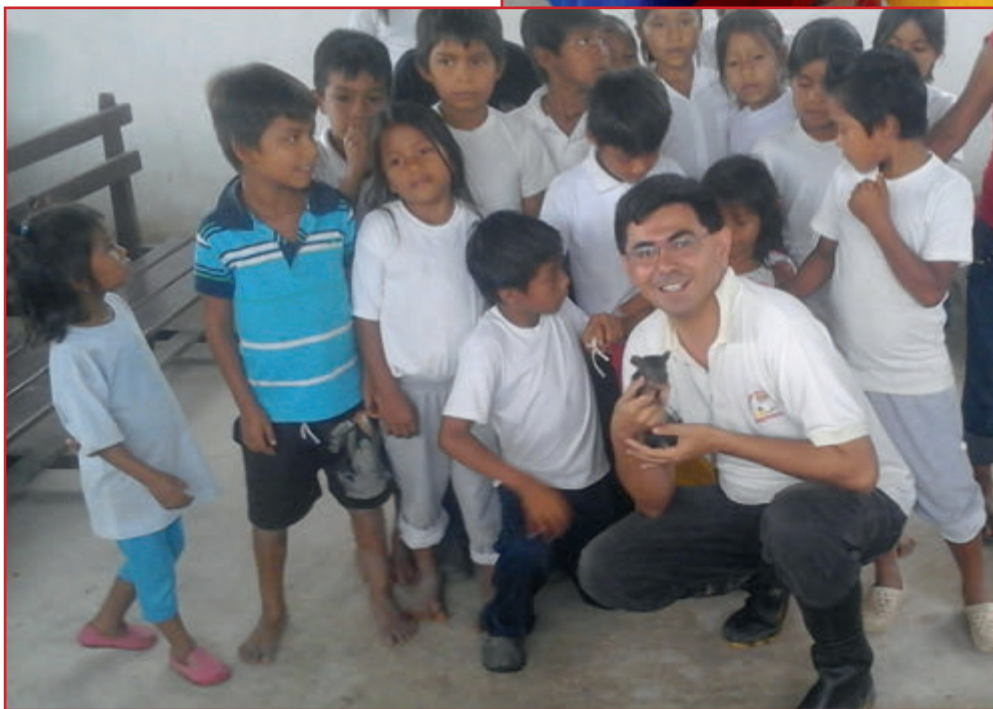
Gemeinsames Foto nach der Kinderkatechese