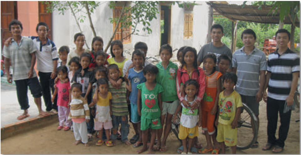
Großfamilie beim Besuch der Seminaristen

stärkt und aufgebaut. Außerdem wurde das Leben dieser ausgegrenzten Menschen verbessert.