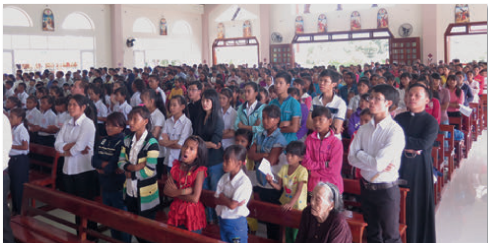
Gottesdienst in einer der besuchten Pfarreien

Dank dieser pastoralen Aktivitäten in den Khanh Vinh-Pfarreien wurde der Glaube bei den Kindern und das religiöse Leben der hiesigen Menschen ge-