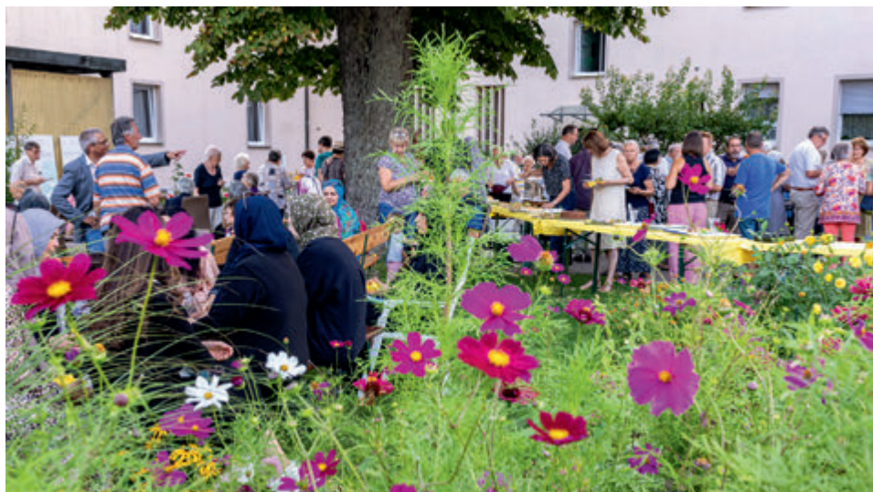
Austausch und Näherkommen beim gemeinsamen interkulturellen Buffet

Am Samstag, den 09. September 2023, war es soweit. Der neue Petrus-Claver-Weg wurde nach einem feierlichen Gottesdienst im Garten der Petrus-Claver-Schwwestern in Oberhausen von Pfarrer Bernd Weidner eingeweiht.