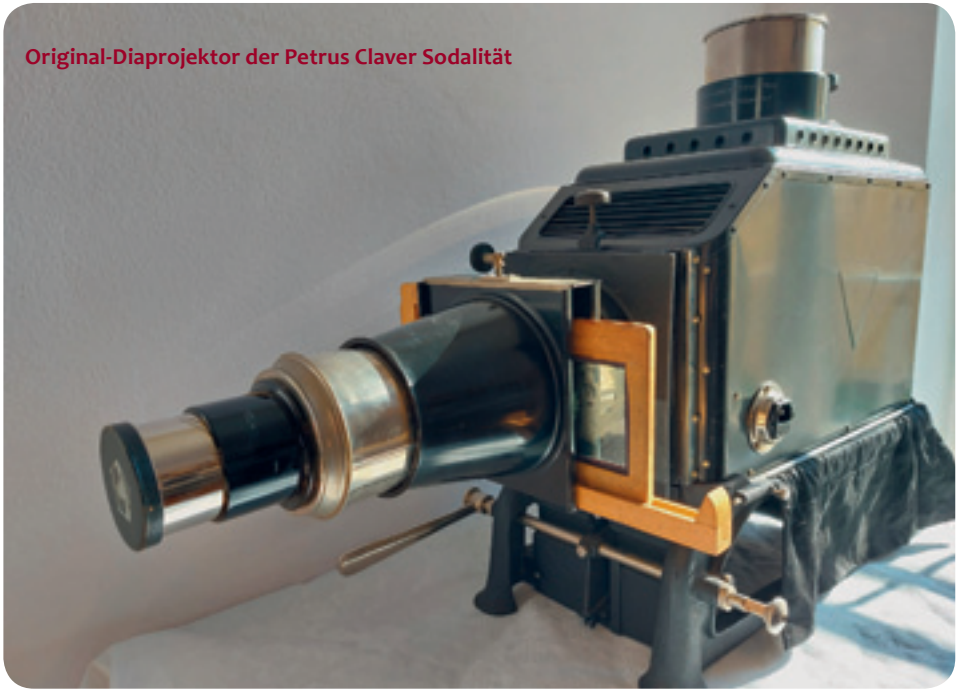
Original-Diaprojektor der Petrus Claver Sodalität