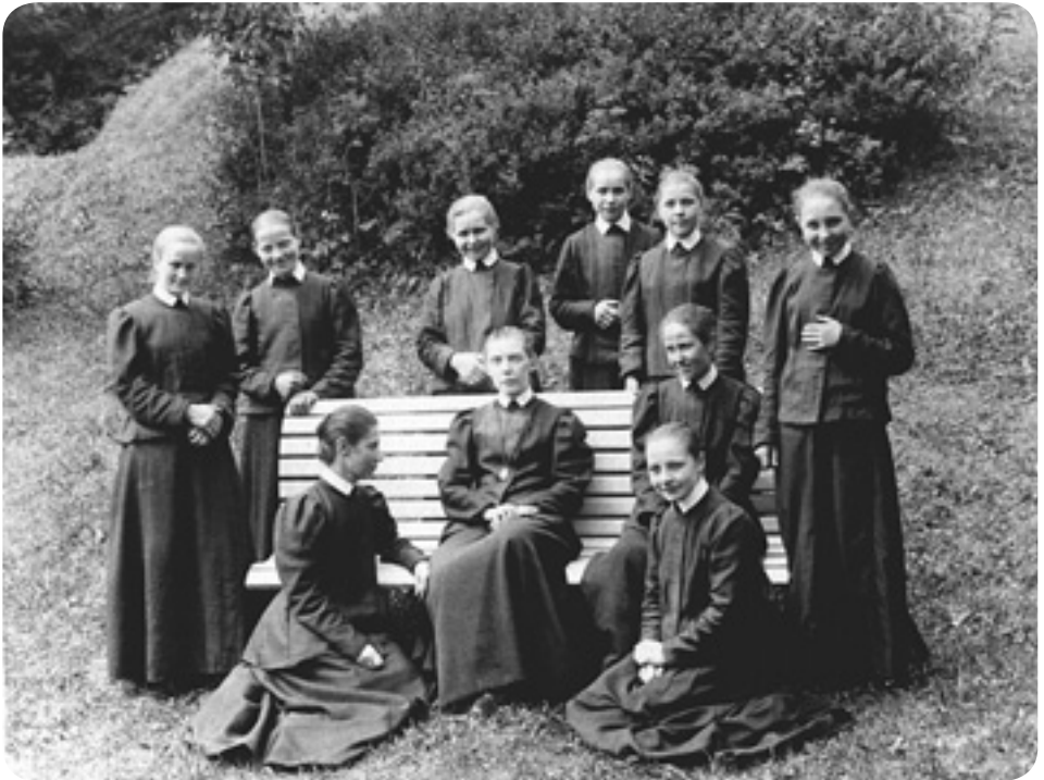
Maria Theresia Ledóchowska mit den ersten Schwestern in Maria Sorg