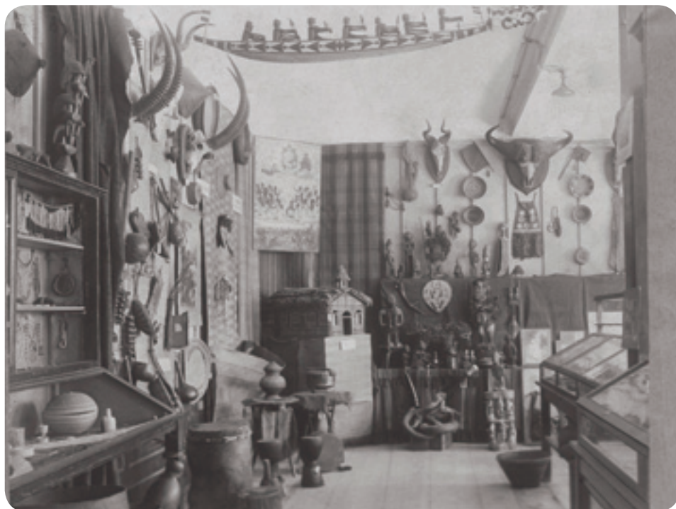
Museum im Claverianum