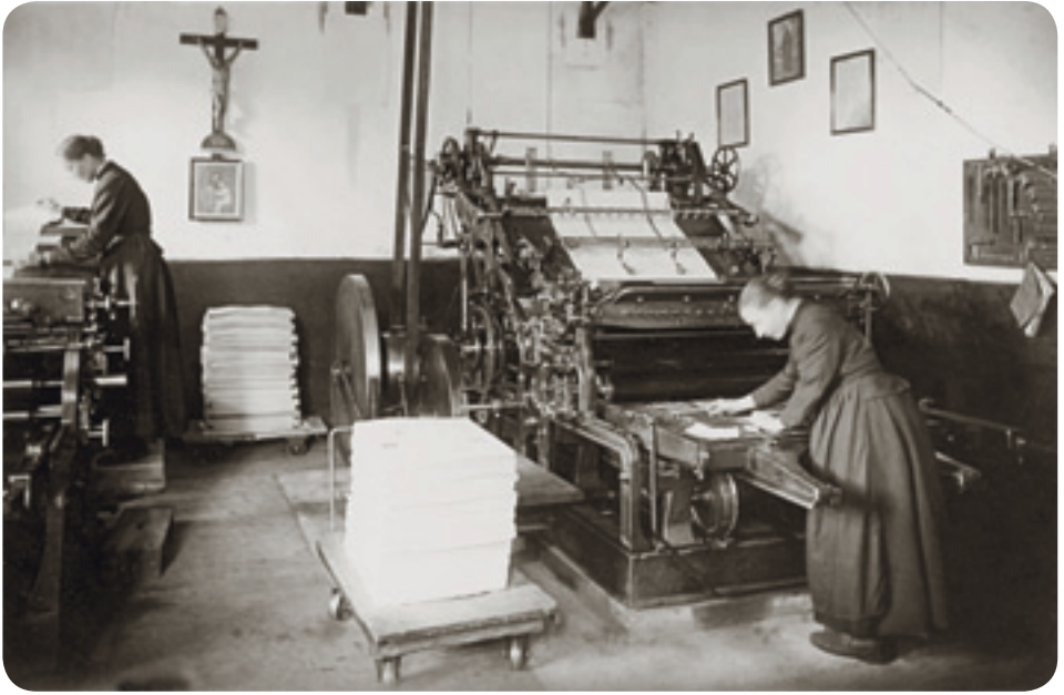
Druckerei in Maria Sorg