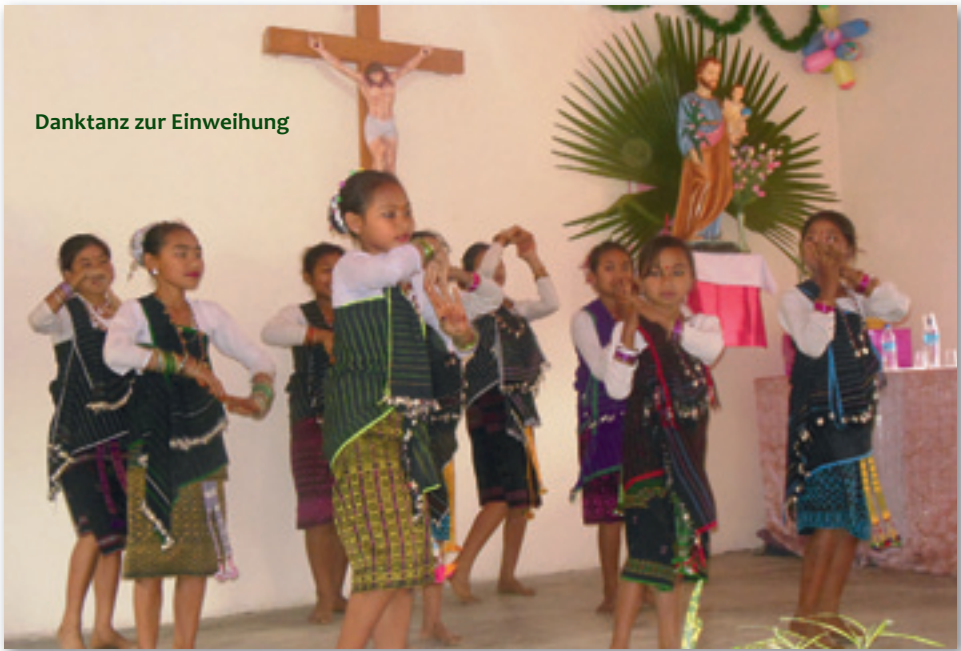
Danktanz zur Einweihung

zeit möglich. In der Sommerzeit waren die Pfarreiangehörigen im Dorf Dipik ohne Gottesdienst. Nun hat sich dies geändert.