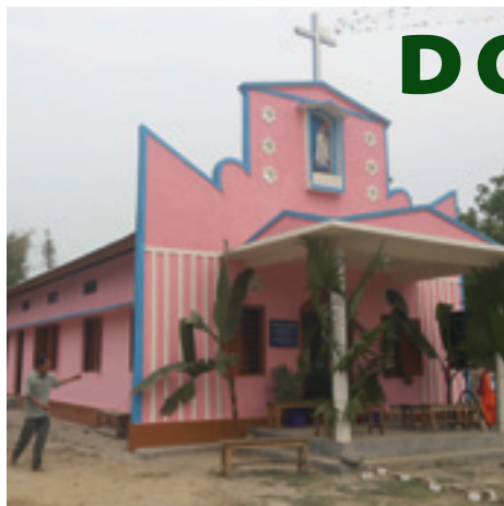
Dorfkirche von Dipik