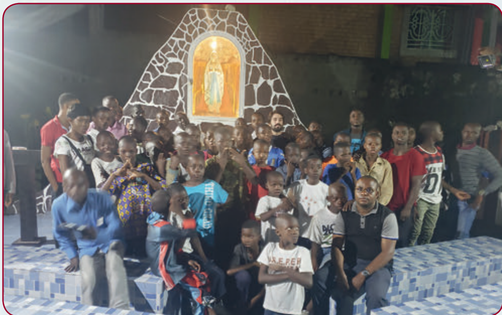
Kapelle im Esengo-Zentrum

Mindestens 450 Straßenkinder werden von den Missionaren jährlich begleitet und betreut. Bezüglich der beruflichen Ausbildung sind es jährlich mindestens 120 Kinder, Mädchen und Jungen, die im Ausbildungszentrum »Don Guanella« in Limete aufgenommen werden. Diese erhalten zuerst Kurse zur Alphabetisierung oder Angleichungskurse, wenn sie vor ihrem Straßenleben schon eine Schule besucht haben.