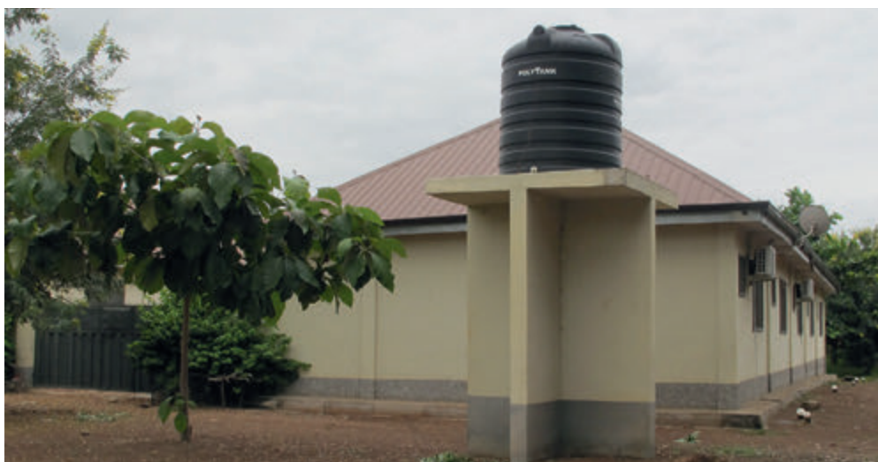
St. Franz Xaver-Kirche außen mit Wassertank