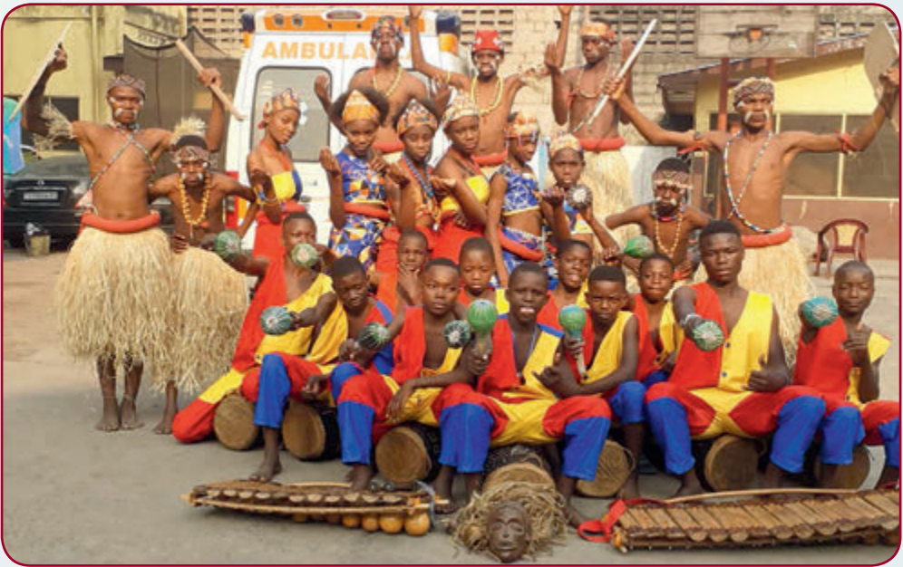
Sing- und Tanzgruppe des Esengo-Zentrums

Das Zentrum organisiert die weitere Lehre für Jungen und Mädchen z. B. als Bäcker, Konditor, Schneider, Näher oder Schreiner. Die Jugendlichen werden zudem in Unternehmensbildung geschult, um sie auf die Selbständigkeit vorzubereiten.