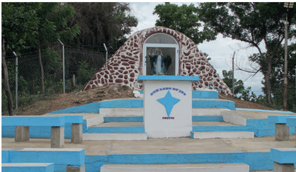
Mariengrotte »Unsere Lieben Frau von der Freude«