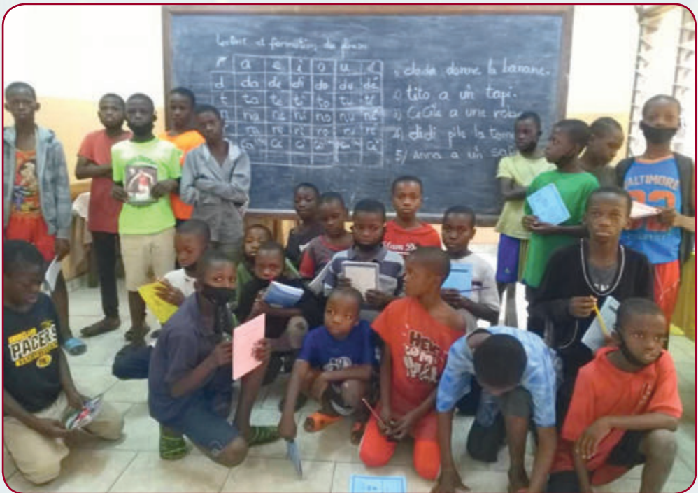
Alphabetisierungskurs für Jugendliche

Aufnahmezentren, vorübergehende Beherbergung, Ambulanzen, Werkstätten und Angebote zur beruflichen Ausbildung stehen diesen Straßenkindern offen.