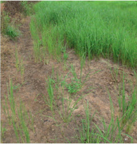
Ein Stück bewässertes Reisfeld neben einem ausgetrockneten

viele selbstproduzierte Nahrungsmittel an die bedürftigen Pfarreimitglieder verteilt.