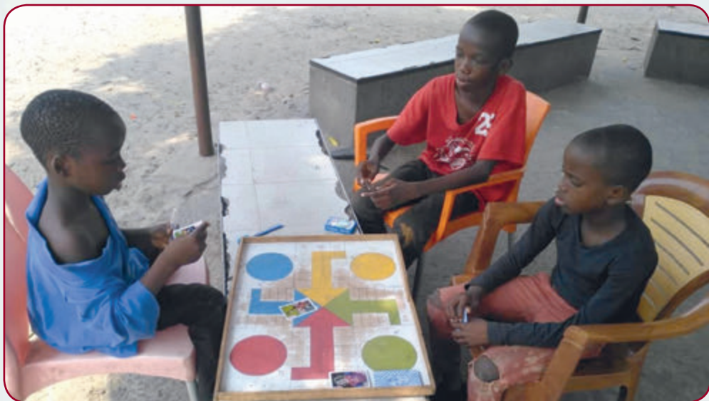
Spiel als Lernhilfe

Mindestens 450 Straßenkinder werden von den Missionaren jährlich begleitet und betreut. Bezüglich der beruflichen Ausbildung sind es jährlich mindestens 120 Kinder, Mädchen und Jungen, die im Ausbildungszentrum »Don Guanella« in Limete aufgenommen werden. Diese erhalten zuerst Kurse zur Alphabetisierung oder Angleichungskurse, wenn sie vor ihrem Straßenleben schon eine Schule besucht haben.