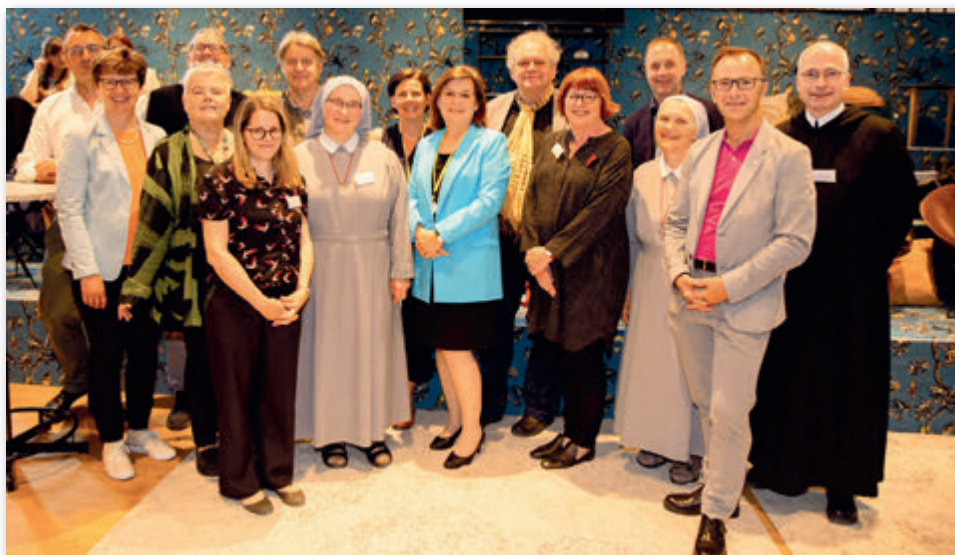
Referenten am Symposium