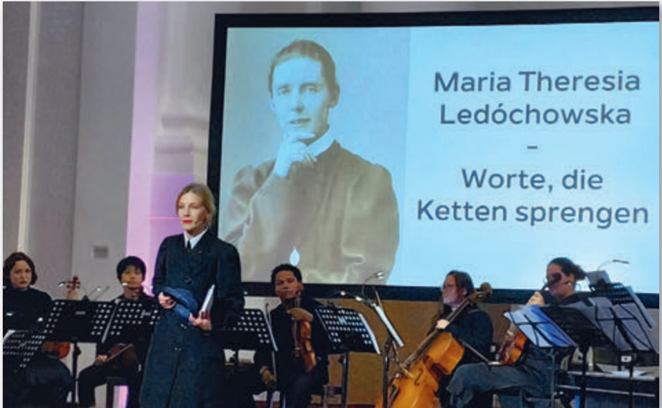
Melodrama am Vorabend des Symposiums in der Kollegienkirche in Salzburg

Vom 15. bis 16. Juni 2023 fand ein Symposium in Salzburg statt unter dem Titel: Salzburg und Afrika im Leben der Gründerin, Maria Theresia Ledóchowska. In folgendem Beitrag teilt einer der zahlreichen TeilnehmerInnen mit uns seine Eindrücke und Überlegungen: