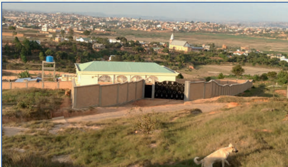
Sicht auf Klostergelände und Dorf

unserem Gebet in all Ihren Anliegen drücken wir unsere Dankbarkeit für Ihre Gabe aus. Der Herr vergelte es Ihnen!