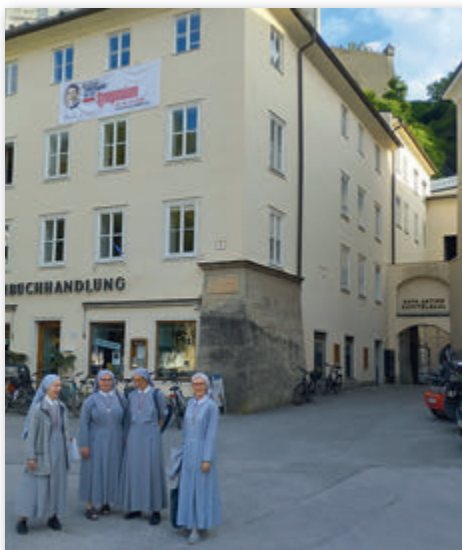
Teilnehmende Missionsschwestern vom hl. Petrus Claver vor dem Kapitelsaal

Wirken und ihren Schriften notwendig ist, wird auch dadurch unterstrichen, dass es bis heute über sie keine nach wissenschaftlichen Kriterien erstellte Biografie gibt.