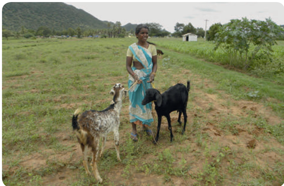
Ziegengabe und im Hintergrund die neugebauten Behausungen

Alle diese Behausungen halten dem Sturm oder großen Regen nicht stand.