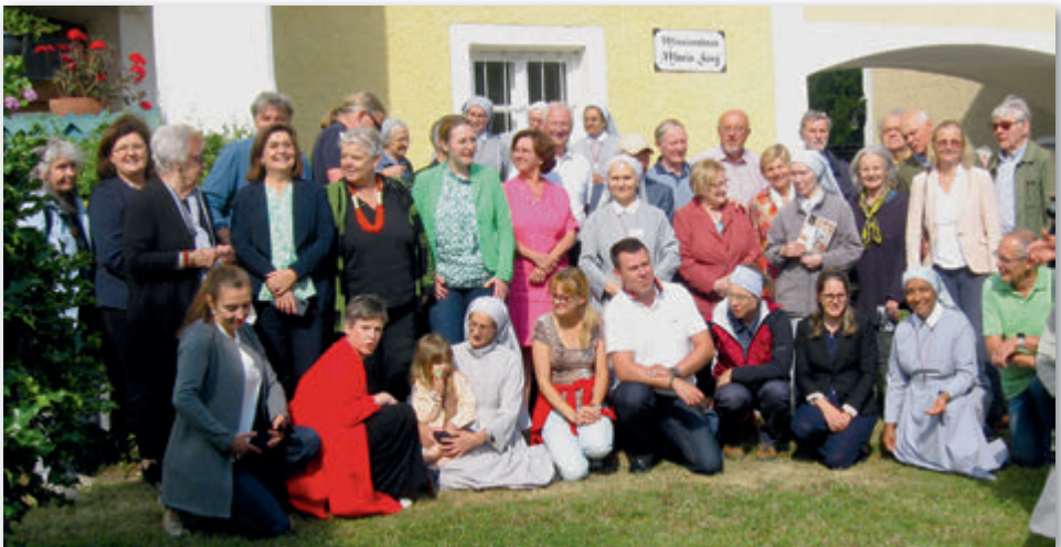
Gruppenfoto in Maria Sorg zum Abschluss